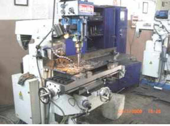
TABLA ÖLÇÜLERİ: 1250 X 3000 MM MAX. İŞ KAPASİTESİ: 1500 KG