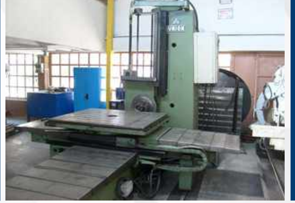
TABLA ÖLÇÜLERİ: 1300 X 1300 MM X HAREKETİ: 1750 MM Y HAREKETİ: 2500 MM Z HAREKETİ: 1300 MM MAX. İŞ KAPASİTESİ: 5000 KG